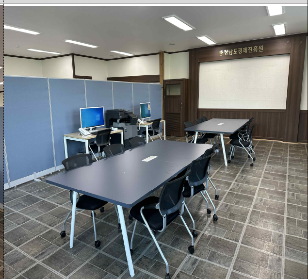
공유오피스 전경 ②