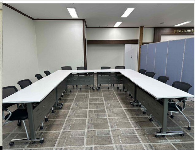
공용공간(커뮤니티 및 회의 공간)