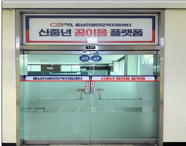
꿈이음 플랫폼 입구